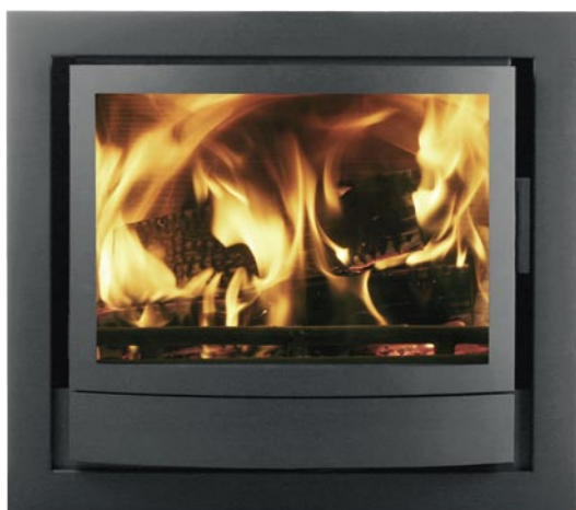
IT43 - Graphite

Ancora più calore radiante in casa vostra, grazie all'altezza del modello ITH. Una cornice in nickel può essere fornita opzionalmente con gli inserti IT e ITH.