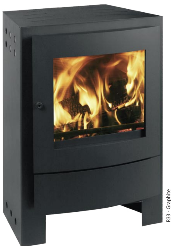
R33 - Graphite

Il modello R è disponibile nei colori graphite o alumat.